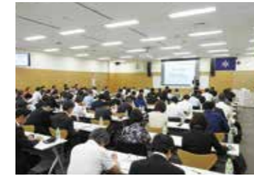
企業向けセミナー