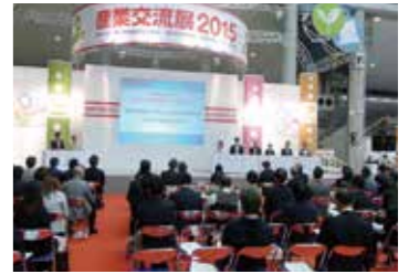
産業交流展シンポジウム