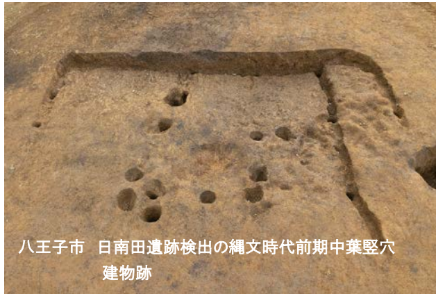
八王子市 日南田遺跡検出の縄文時代前期中葉竪穴 建物跡