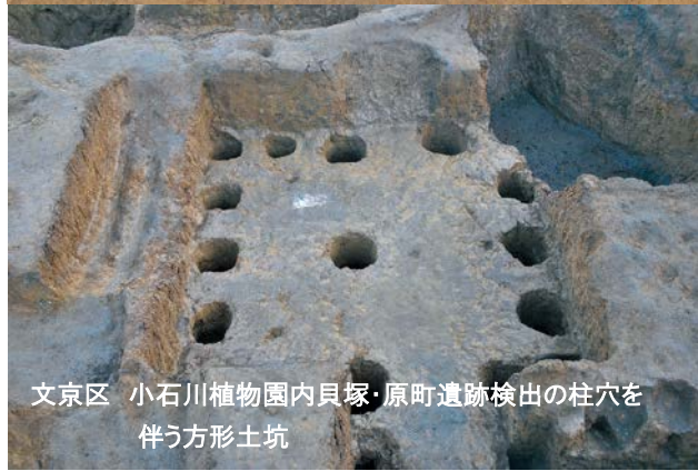
文京区 小石川植物園内貝塚・原町遺跡検出の柱穴を 伴う方形土坑