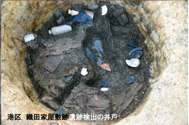
港区 織田家屋敷跡遺跡検出の井戸